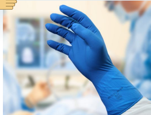
Protexis® Latex Blue Neu-Thera