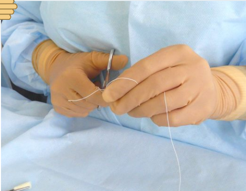
Protexis® Latex Neu-Thera